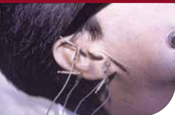
Elektrostimierte Ohrakupunktur bei operativen Kiefereingriffen