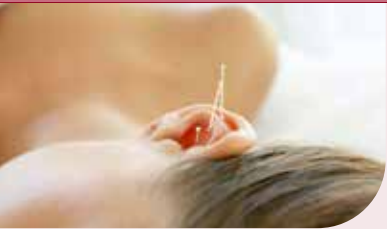
Akupunktur z.B. bei entzündlicher Kiefer- und Gesichtsschwellung