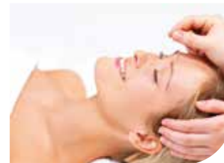
Akupunktur – Erfahrung aus vier Jahrtausenden.

Die klassische Behandlung mit Nadeln, wie auch die Elektroakupunktur, stimulieren körpereigene Systeme und unterstützen so das Immunsystem und die Selbstheilungskräfte des Organismus.