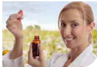
Homöopathische Mittel werden individuell dem Patienten angepasst.

„Ähnliches mit Ähnlichem“ behandeln ist eines der Grundprinzipien der Homöopathie. In hoher Konzentration schädlich, stark verdünnt aber hilfreich, können homöopathische Mittel unter anderem Schwermetalle aus ihren Verbindungen im Körper herauslösen und damit einen ersten Schritt zur Entgiftung einleiten. Ihr Arzt wählt, unter Berücksichtigung Ihrer individuellen Situation, ein für Sie geeignetes Einzel- oder Komplexmittel aus.