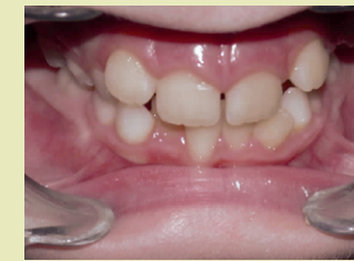
Patient vor der Behandlung