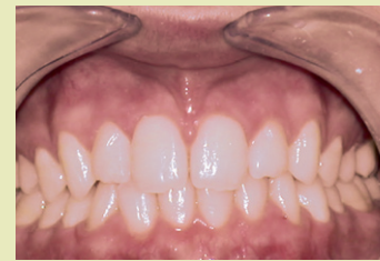
Patient nach der Behandlung