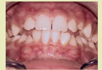
Patient nach der Behandlung