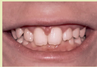
Patient vor der Behandlung

(Die Anwendung der Lymphdrainage darf nur von speziell ausgebildeten Therapeuten angewendet werden. BNZ-Mitglieder dürfen nur als Verordner tätig werden)