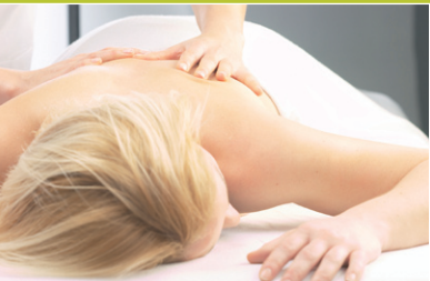
Entlang der Lymphbahnen werden bestehende Stauungen gelöst